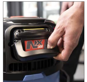
Snabbt, Enkelt Batteribyte